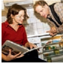
Hilfen für Menschen mit psychischen Erkrankungen

Teilhabe an Arbeit, Bildung und Heimat – Gustav Werner ermöglichte sie in seiner Zeit und mit seinen Mitteln. Sein Werk und seine Vision leben bis heute in der BruderhausDiakonie fort. Heute unterstützen rund 3.500 Mitarbeitende der BruderhausDiakonie 10.000 alte und junge Menschen, Menschen mit Behinderungen und psychischen Erkrankungen in 14 Landkreisen Baden-Württembergs.