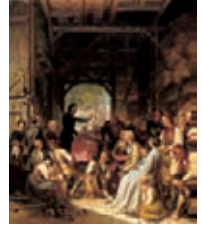
Gustav Werner zog als Wanderprediger durch das Land und gewann dadurch viele Unterstützerinnen und Unterstützer. Gemälde von Wilhelm Emil Robert Heck, 1862

Gustav Werner war überzeugter Christ. Die Vision vom Reich Gottes trieb ihn an. Er war charismatischer Diakoniegründer und Industrie pionier.