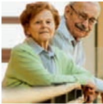
Hilfen für alte Menschen