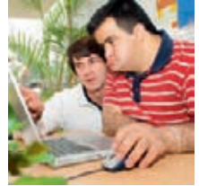
Hilfen für Menschen mit geistigen Behinderungen