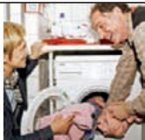
Heute leben Menschen mit Behinderungen oder psychischen Erkrankungen mitten im Ort – dort, wo auch ihre Freunde und Angehörigen wohnen.

Ältere Menschen bleiben in ihrer eigenen Wohnung oder finden im Seniorenzentrum ein neues Zuhause. Die Mitarbeitenden der BruderhausDiakonie und viele ehrenamtlich Engagierte helfen, sich daheim zu fühlen und heimisch zu werden.