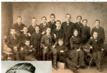
Schule für arme Kinder und Waisenkinder, um 1900