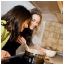
Hilfen für junge Menschen