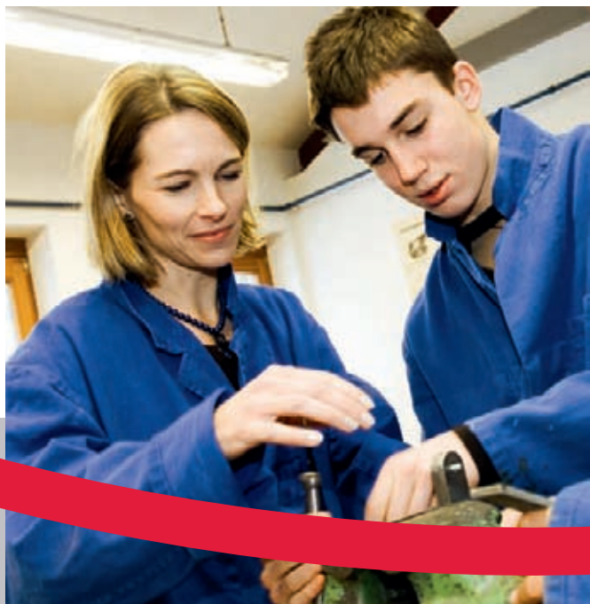
Junge Menschen mit Benachteiligungen erhalten Chancen.

„Ich lerne Metallfeinbearbeiter bei der BruderhausDiakonie. Meine Ausbilder helfen mir, wenn es Probleme gibt.“