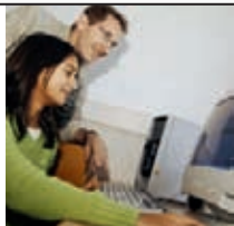
Ausbildung für Jugendliche mit Benachteiligungen – Chancen geben, Begabungen fördern