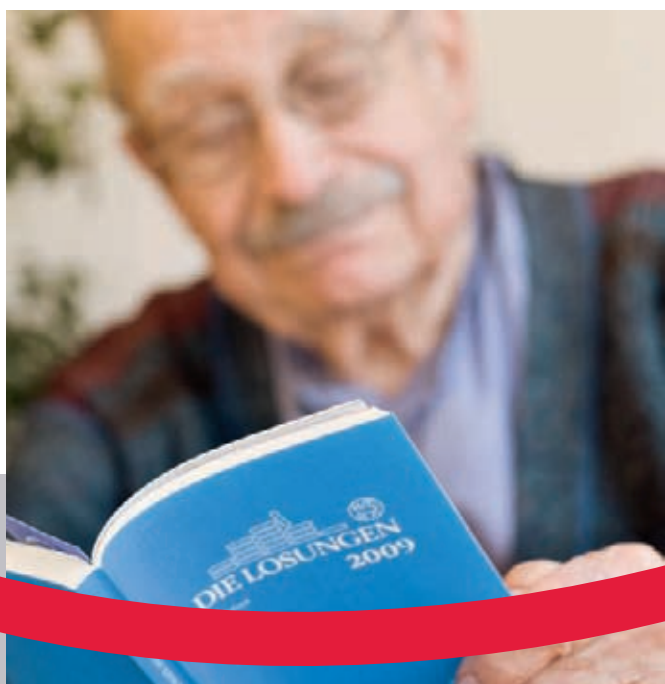
Wie wird ein Pflegeheim zur Heimat? Dazu gehört das eigene Zimmer mit eigenen Möbeln und Erinnerungsstücken, aber auch Gemeinschaft und Zugehörigkeit. Wir feiern Andachten, bieten Seelsorge und Sterbebegleitung.