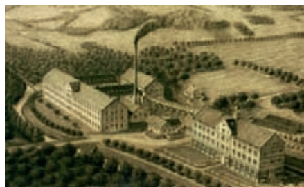
Bruderhaus Dettingen mit der Papierfabrik zum Bruderhaus. Zeichnung von Wilhelm Maybach, 1865/66

Seit der Zeit Gustav Werners hat sich viel verändert. Neben den Arbeitsplätzen in der Produktion gibt es immer mehr Arbeitsplätze für Menschen mit psychischen Erkrankungen im Dienstleistungsbereich.