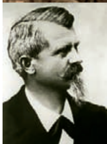
Wilhelm Maybach kam als zehnjähriges Waisenkind ins Bruderhaus. Der spätere Mercedes-Konstrukteur war 1861 bis 1866 Lehrling in der Maschinenfabrik Gustav Werners.

„Ich lerne Metallfeinbearbeiter bei der BruderhausDiakonie. Meine Ausbilder helfen mir, wenn es Probleme gibt.“