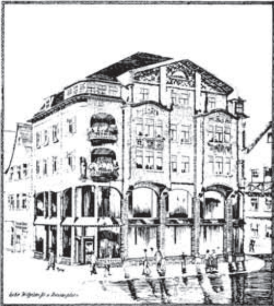
Verkaufsräume der Möbelfabrik am Nikolaiplatz in Reutlingen