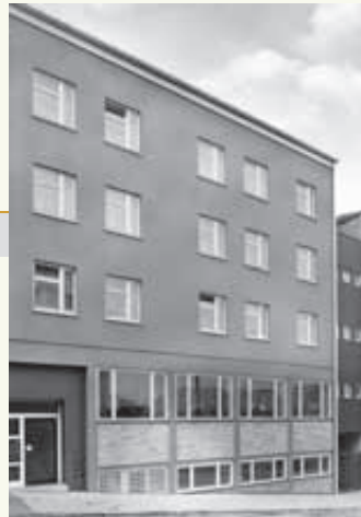
Maria-Martha-Stift, Eugensstraße 4 in Stuttgart

Das psychiatrische Altenpflegeheim mit Therapiezentrum in Stuttgart-Schönberg wird fertiggestellt und Bewohner aus dem Haus Röhrlingweg 9 und aus dem Maria-Martha-Stift in Stuttgart ziehen ein (heute Seniorenzentrum Schönberg). In den Folgejahren ist es verstärkt das Bemühen von Haus am Berg, die Arbeit weiter zu qualifizieren. Räumliche Verbesserungen für die Unterbringung der Heimbewohner stehen an, eine Auflockerung der Belegung an den unterschiedlichsten Standorten sind die Folge. Die Zahl der Mitarbeitenden erhöht sich in wenigen Jahren auf etwa 550, und die hierfür notwendigen Arbeitsplätze werden geschaffen. Insgesamt werden etwa 1000 Menschen an acht Standorten versorgt, gefördert und gepflegt.