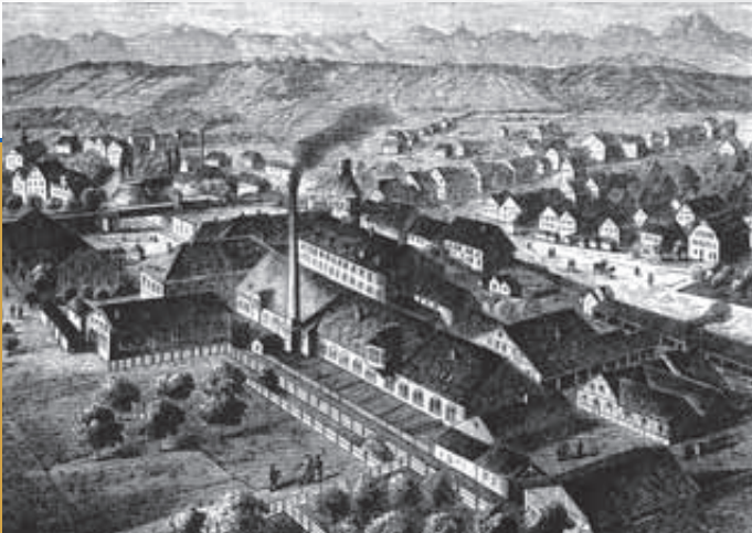
Das Bruderhaus mit den Vereinigten Werkstätten nach einer Zeichnung von Wilhelm Maybach

Während der fünfjährigen Lehrzeit besuchte ich abends die städtische Fortbildungsschule in Physik und Freihandzeichnen, in welcher letzterem ich mit Hilfe meines technischen Zeichnens es zur Anfertigung perspektivisch-konstruierter Anlagen brachte (...) Am Ende meiner Lehrzeit durfte ich die mathematischen Fächer der städtischen Oberrealschule besuchen (...) Sprachunterricht erteilte mir und meinen Freunden ein kaufmännischer Angestellter unserer Fabrik; in aller Frühe durften wir ihn dazu wecken (...)