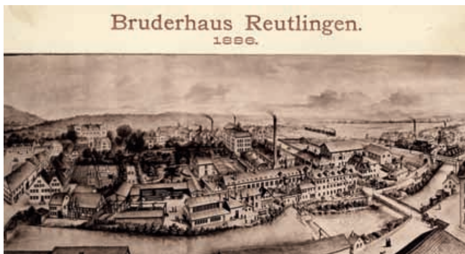
Die Mutteranstalt der Stiftung im Jahr 1886