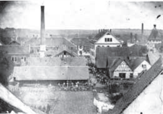
Ackergeräte-Fabrik um 1863