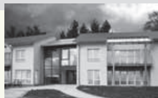
Wohnhaus am Spital in Ehingen (Donau)

Im Januar 2001 wird das „Wohnhaus am Spital“ in Ehingen (Donau) eingeweiht. 17 Bewohnerinnen und Bewohner bereiten sich hier auf eine offenere Wohnform vor. Dem Wohnhaus angegliedert ist ab diesem Zeitpunkt das ambulant betreute Wohnen (heute Sozialpsychiatrische Hilfen Alb-Donau).