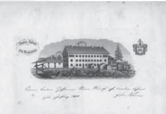
Die erste Papierfabrik in Reutlingen

Der Beginn der Industrialisierung im 19. Jahrhundert brachte große soziale Nöte für die Arbeiterschaft, die von einem rücksichtslosen Unternehmertum ausgebeutet wurde. Die Antwort der Arbeiter war endlich die Bildung von Gewerkschaften, die ihre Interessen vertraten und auch durchsetzten. Gustav Werner versuchte, einen anderen Weg zu beschreiten, um die Not der Arbeiter zu beheben. Er gründete „christliche Fabriken“, in denen aus christlichem Geist die Interessen des Unternehmers und der Arbeiterschaft einen harmonischen Ausgleich finden sollten.