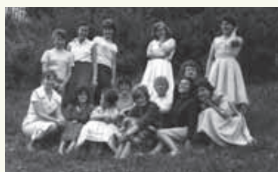
Mädchenwohnhaus in Stuttgart-Schönberg

Zunächst Anmietung und dann Bau eines Mädchenwohnheimes mit 50 Plätzen sowie Errichtung eines Altenwohnheims mit zwölf Plätzen in Stuttgart-Schönberg (heute Seniorenzentrum Schönberg).