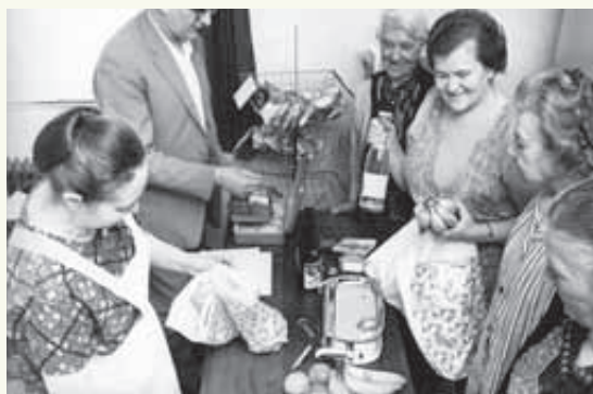
Lädle Heim Waldeck, Nagold

19. Oktober 1976 Umzug der Altenpflegeschule von Stuttgart nach Bad Urach (heute Diakonisches Institut für soziale Berufe).