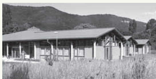
Werkstatt in Dettingen/Erms