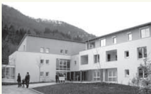
Betreute Seniorenwohnanlage An den Mauergärten

21 betreute Seniorenwohnungen „An den Mauergärten“ in Bad Urach werden fertiggestellt und im Dezember 2001 bezogen. Diese Wohnanlage entspricht allen Anforderungen für Betreutes Seniorenwohnen und erhält dafür das Qualitätssiegel.