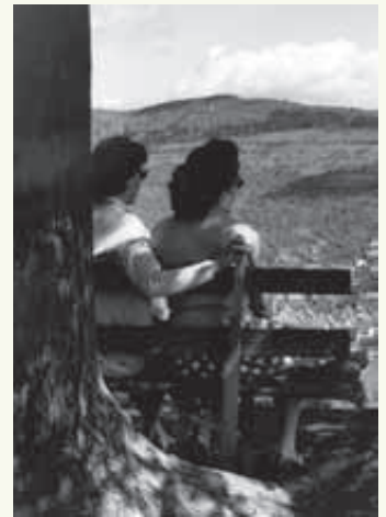
Blick vom Calverbühl in Dettingen/Erms

33 Bewohnerinnen vom Maria-Martha-Stift in der Eugenstraße 4 ziehen ins Haus am Eugensplatz, Alexanderstraße 1 in Stuttgart um. Das Maria-Martha-Stift wird wegen der Stuttgarter Kulturmeile (Staatsgalerie) abgerissen (heute Sozialpsychiatrische Hilfen Stuttgart).