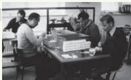
Beschäftigte im Heim Fischerhof

Fertigstellung eines Erweiterungsbaues der Werkstatt für behinderte Menschen und der Hauptverwaltung in Urach, Münsinger Straße 96 (heute Werkstätten, Ausbildungsverbund).