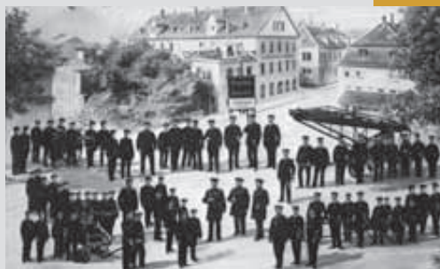
Feuerwehr des Bruderhauses

Diesem Zweck der „Jugendberufshilfe“ (so der heutige Fachbegriff) dienten die zahlreichen Handwerksbetriebe und die Fabriken. Lehrlinge erhielten im Bruderhaus von Anfang an Entlohnung, dazu auch Gelegenheit und Anleitung zum Selbststudium in fachlicher Hinsicht. Wöchentliche Sing- und Turnstunden und gemeinsame Wanderungen standen auf dem Plan. Theaterspielen für den Hausgebrauch war möglich. Pflicht hingegen war die Teilnahme an den Übungen der Bruderhaus-Feuerwehr. Schon damals ermöglichte er Ausländern (vor allem Griechen) in seinen Einrichtungen eine Ausbildung, um so dem betreffenden Land einen Dienst zu erweisen.