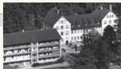
Johannes Brenz Haus (l.), Käthe Luther Haus (r.), in Bad Urach