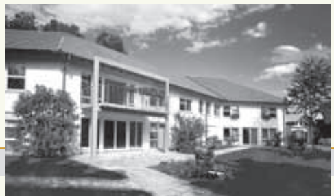
Gerontopsychiatrisches Pflegeheim Königshöhe in Dettingen/Erms

Einweihung des neu errichteten Hauses Bleichfeld der Heime im Ermstal in Bad Urach (heute Behindertenhilfe Ermstal). In Tübingen wird ein niedrighschwelliges Arbeits-, Beschäftigungs- und Qualifizierungsangebot für Jugendliche und junge Erwachsene eingerichtet. Zunächst „Nabe“ genannt, lautet der Name ein Jahr später „Spielwerk“. Verpachtung der Landwirtschaft in Buttenhausen.