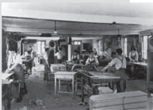
Lehrlingswerkstatt in der Möbelfabrik