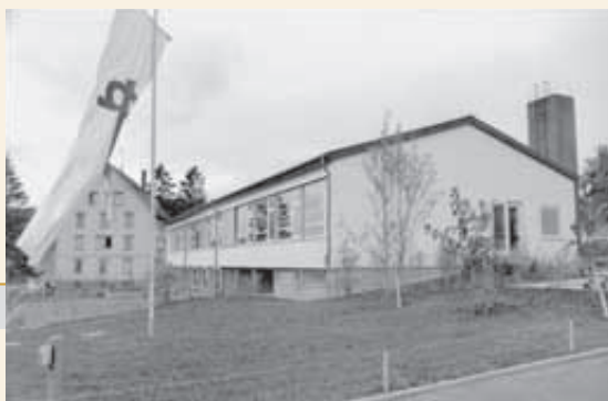
Einweihung des Heinrich-Landerer-Krankenhauses (heute PP.rt)

Die Haus am Berg gGmbH betreut an vier Standorten 550 Menschen und hat 80 Mitarbeiterinnen und Mitarbeiter.