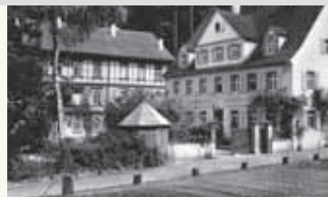
„Heim Kirnhalden“, in Herbolzheim- Kenzingen

Einweihung der Ludwig-Haap-Schule (Schule für Erziehungshilfe) beim Kinderheim Rodt (heute Jugendhilfeverbund Kinderheim Rodt). Einrichtung einer Schule für Pflegehelfer in Reutlingen.