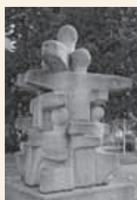
Am Gustav Werner Platz wird das Denkmal für die Opfer der Euthanasie enthüllt.

Gedenk-Gottesdienst für die Opfer der Euthanasie im Dritten Reich im Bruderhaus mit Vorstellung einer Dokumentation und Enthüllung von Gedenktafeln in Reutlingen und im Schwarzwald. Die Landwirtschaft auf der Bleiche wird Biolandhof.