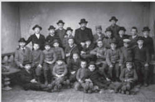
Eine Schulklasse im Kinderhaus um 1900