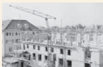
Das Altenpflegeheim in der Gustav-Werner-Straße im Bau

Einweihung des Lehrlings- und Jugendwohnheims „Friedrich-Naumann-Haus“ in Reutlingen.