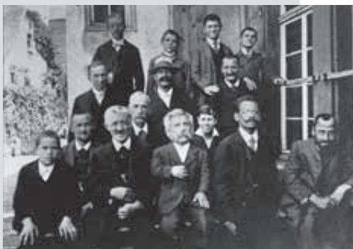
Gruppenbild aus der Mutteranstalt um 1928