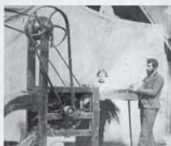
Produkte aus der Ackergeräte-Fabrik