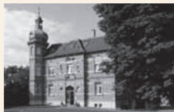
Riesenhof in den 60er Jahren

Umwandlung des Hauses in Alpirsbach in ein Altenheim (heute Seniorenzentrum Alpirsbach). Erwerb des Riesenhofes bei Ravensburg (heute Sozialpsychiatrische Hilfen Ravensburg-Bodenseekreis).