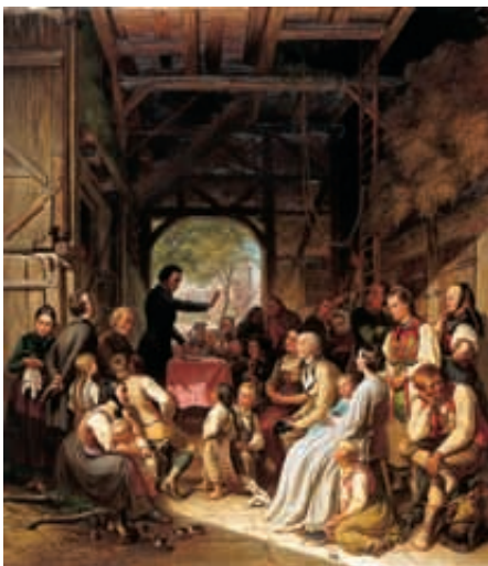
Scheunepredigt (Gemälde von Robert Heck)