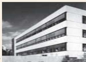
Die Verwaltung der Gustav Werner Stiftung kurz vor der Einweihung

Im August 1972 Erwerb des „St. Georgenhofs“ in Pfronstetten, Kreis Reutlingen, eines landwirtschaftlichen Gutsbetriebs und Freizeitheims (heute Freizeitheim St. Georgenhof).