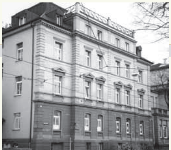
Haus am Eugensplatz, Stuttgart

33 Bewohnerinnen vom Maria-Martha-Stift in der Eugenstraße 4 ziehen ins Haus am Eugensplatz, Alexanderstraße 1 in Stuttgart um. Das Maria-Martha-Stift wird wegen der Stuttgarter Kulturmeile (Staatsgalerie) abgerissen (heute Sozialpsychiatrische Hilfen Stuttgart).