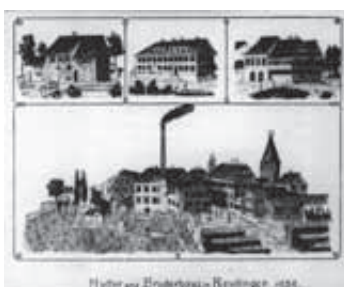
Erste Anstaltsgebäude auf dem Stadtgraben