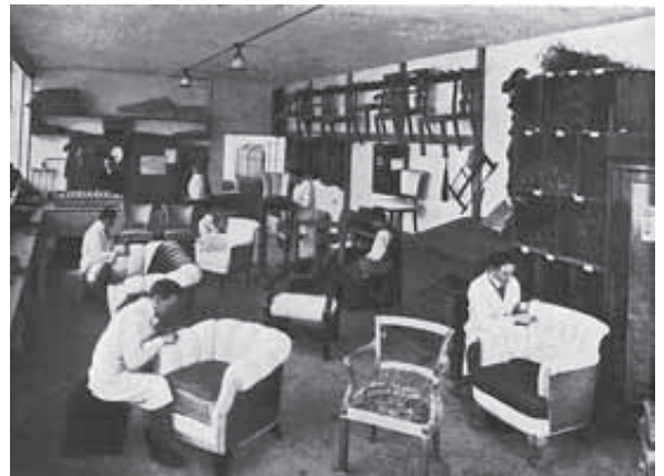
Polsterei der Möbelfabrik